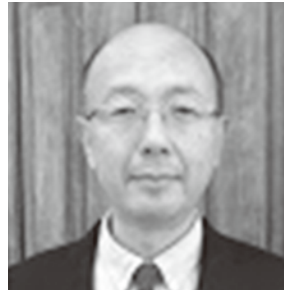
東徳島福音ルーテル教会 牧師