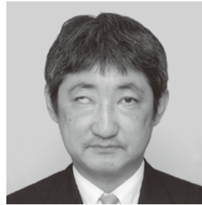
徳島恵キリスト教会 伝道師